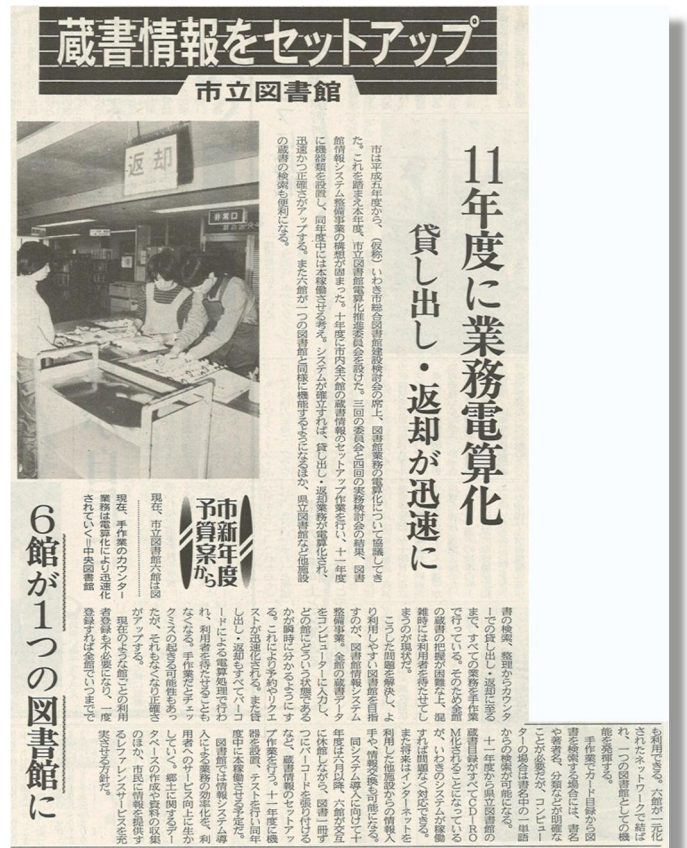
懐かしい貸出風景です （「いわき民報」平成10年3月18日）

今ではインターネットができれば、好きなときに好きな場所で図書館とつながることができます。ひと昔前の、人の手が利用者と本をつないでいた時代に比べれば、図書館がより身近になった方も多いのではないのでしょうか。図書館では、もっと多くの方と本や情報をつなぐことができるようなサービスを提供していきたいと考えています。