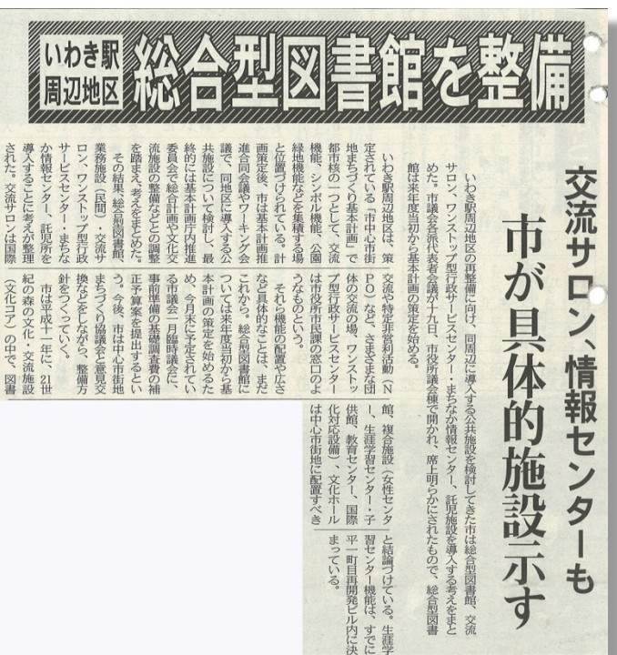
（「いわき民報」平成 13 年 1 月 19 日）

この時点では、いわき駅前再開発ビルは地下 1 階、地上 14 階の予定でした。このうち、図書館は 4 階～8 階に配置されることになっており、5 フロア構成となっていました。