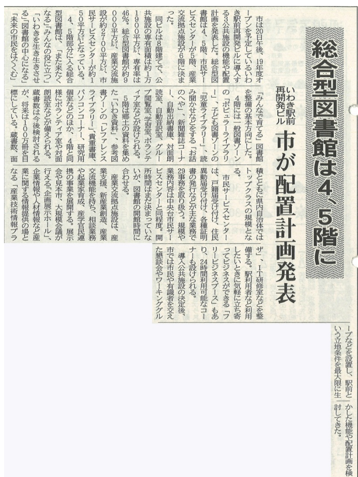
（「いわき民報」平成 16 年 2 月 21 日）

平成 6(1994)年に「総合型図書館構想」が打ち出されてから、13 年が経過していました。