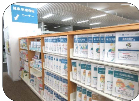
4階「健康・医療情報コーナー」

国立がん研究センターや、いわき市医療センターの「がん相談支援センター」等と連携を図りながら、今後も、みなさんの役に立つ、信頼できる情報の提供に積極的に取り組んでまいりますので、どうぞ、ご活用ください。