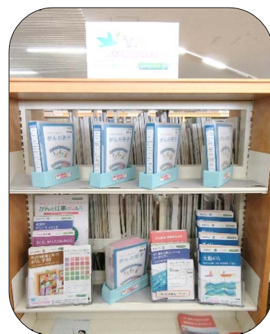
寄贈いただいた「がん情報ギフト」