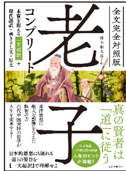
『老子コンプリート』 老子 著 誠文堂新光社