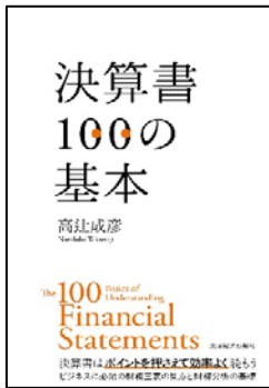
『決算書100の基本』 高辻 成彦 著 東洋経済新報社