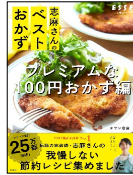
『志麻さんの ベストおかず』 タサン志麻 著 扶桑社