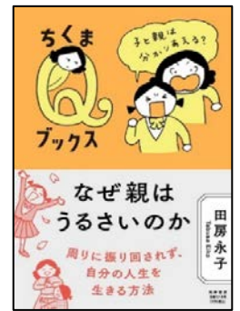
『なぜ親は うるさいのか』 田房 永子 著 筑摩書房