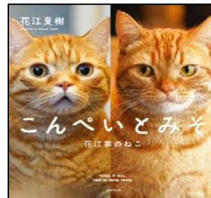
『こんぺいとみそ 花江家のねこ』 花江 夏樹 著 KADOKAWA