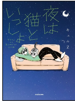
『夜は猫といっしょ』 キュルZ 著 KADOKAWA