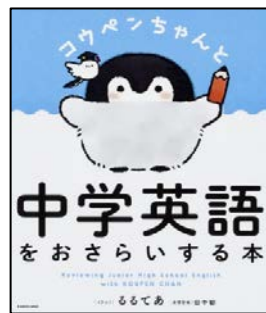
『コウペンちゃんと中学 英語をおさらいする本』 田仲 郁 英語監修 KADOKAWA