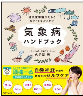
『気象病ハンドブック』 久手堅 司 著 誠文堂新光社