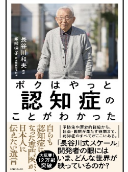
『ぼくはやっと認知症のことがわかった』 長谷川 和夫 著 KADOKAWA