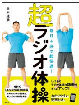
『超ラジオ体操』 谷本 道哉 著 扶桑社