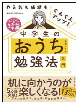
『中学生のおうち勉強法入門』 みおりん 著 実務教育出版