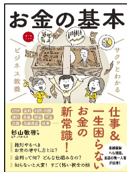
『お金の基本』 杉山 敏啓 監修 新星出版社