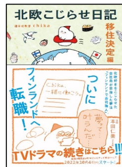
『北歐こじらせ日記』 週末北歐部chika 世界文化社