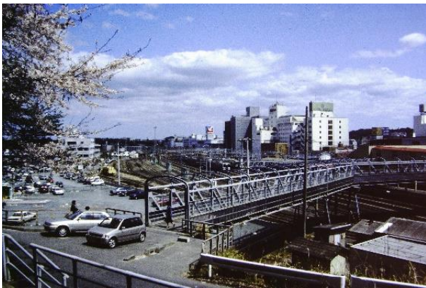
【平安橋】平安橋 平市街の高層ビルが目立つようになった(平成 8(1996)年 4 月 いわき市撮影)