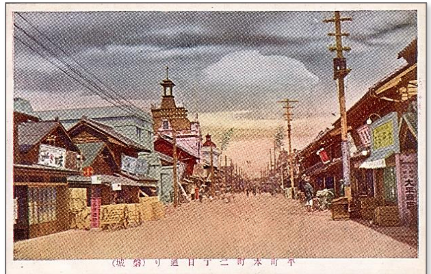
平町本町通り 『平町絵葉書』(佐々木商店 大正時代)

平駅の駅舎は、市街地の中心が駅南方の本町通りであったことから、南向きに開設されました。鉄道開通により人と物の流れは盛んになり、旅館、運送会社、食堂などの商業・サービス業が成立し、駅前周辺は活気に満ちていきました。