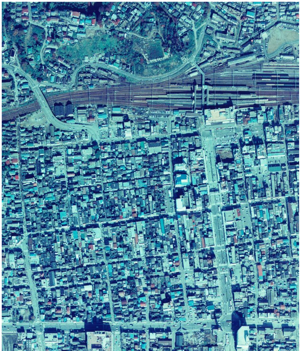
いわき駅周辺 (昭和 50(1975)年 11 月 12 日)