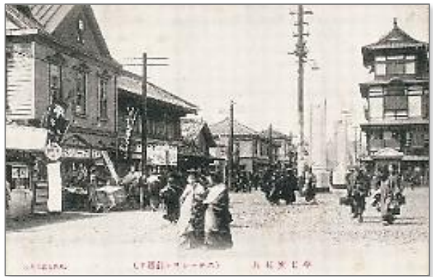
ステーション前通り 平駅前のにぎわい