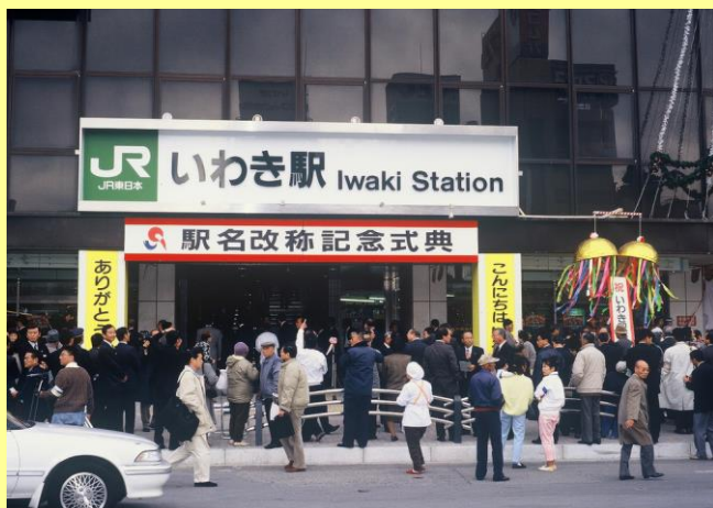
いわき駅誕生(旧・平駅)・駅名改称記念式典 (平成 6(1994)年 12 月)

「平駅」の最終日は、記念に切符を買うたくさんの人々が訪れ、翌日の「いわき駅」誕生日は盛大なセレモニーが行われました。