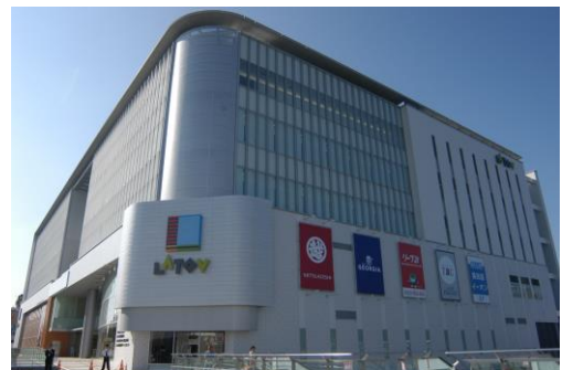
ラトブオープン・全景 (平成 19 年 10 月)