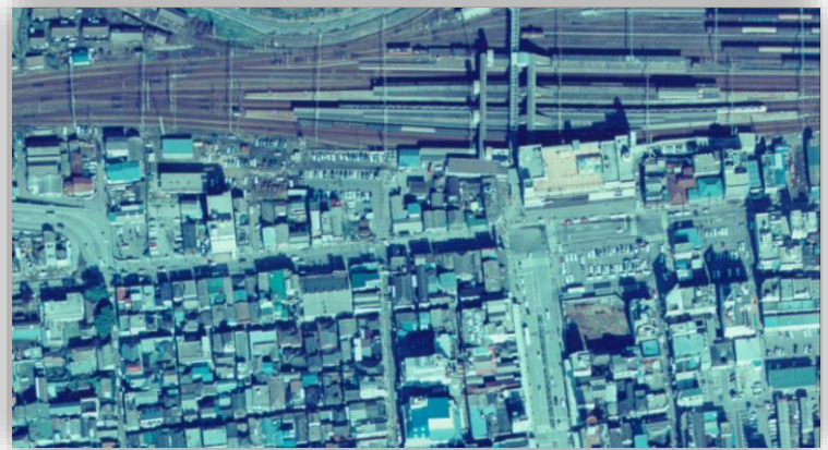
平駅(現いわき駅)周辺（昭和50年11月12日 国土地理院撮影）