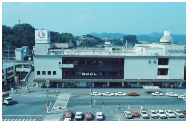
平(現・いわき)駅駅ビル(ヤンヤン)全景

昭和 62(1987)年にリニューアルし、ロゴを「ヤン・ヤン」から「yan—yan」に変更しました。