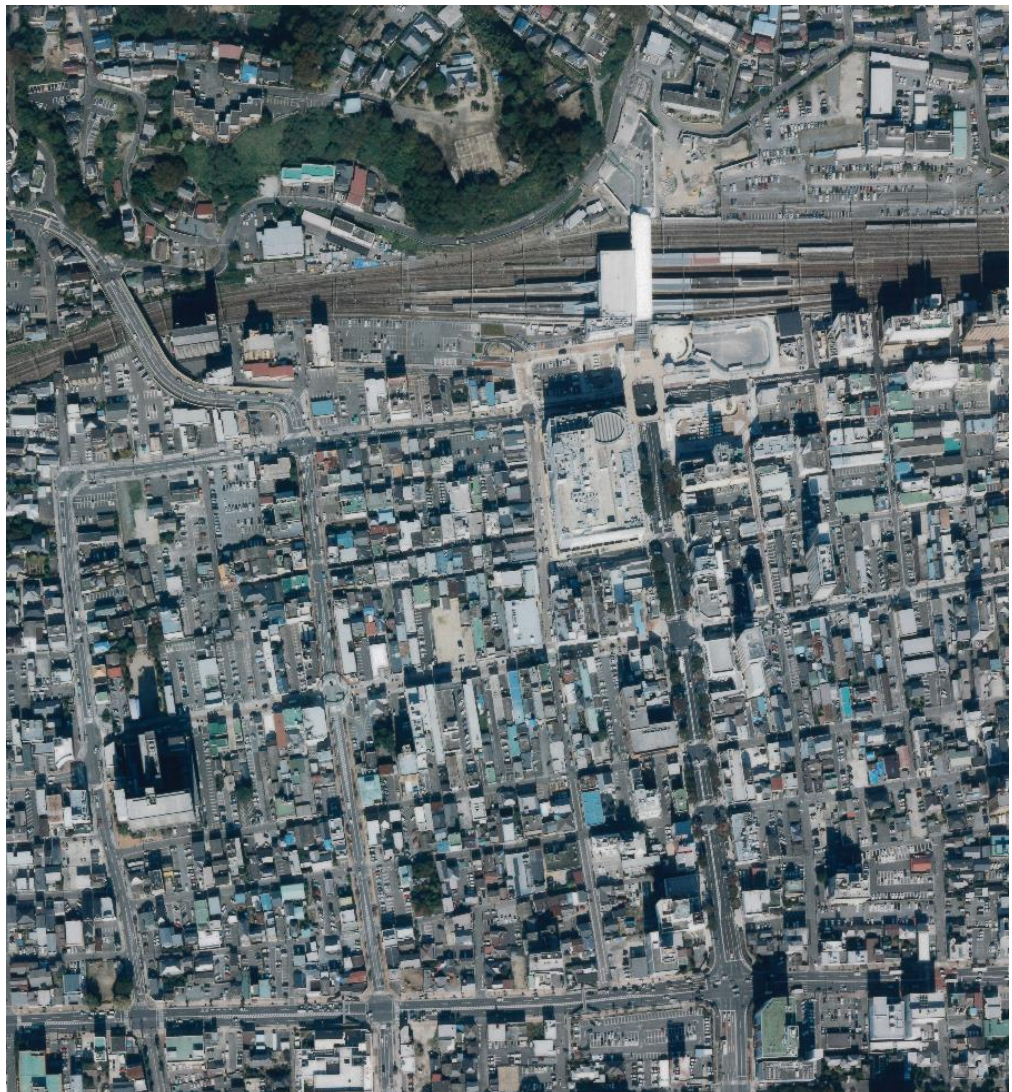
いわき駅周辺 (平成 23(2011)年 10 月 26 日)