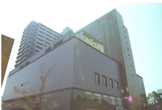
いわき T1ビル外観(平成14(2002)年4月 いわき市撮影)