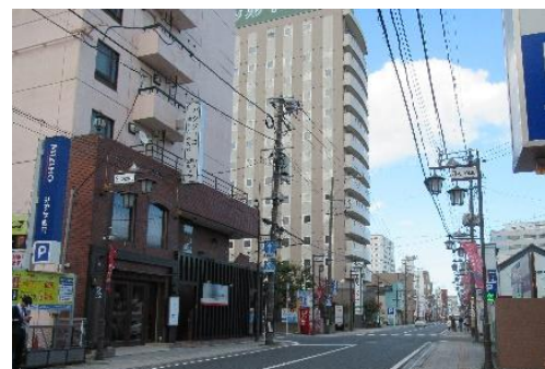
本町通り(令和5(2023)年10月 総合図書館撮影)