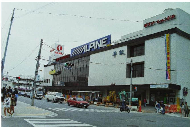
【いわき駅】駅名改称直前”最後の平駅” (平成 6(1994)年 12 月)