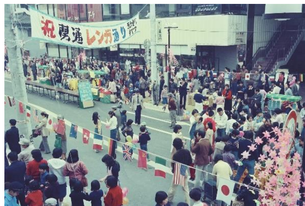
レンガ通りの賑わい (昭和 56(1981)年 4 月)

昭和 63(1988)年 3 月、待望の常磐自動車道の日立北 IC-いわき中央 IC (51.2km) が開通しました。同年 11 月には平-東京の高速バスの運行が開始されました。高速道路の開通は、工業や観光、交流人口の拡大など、大きな影響をもたらしました。