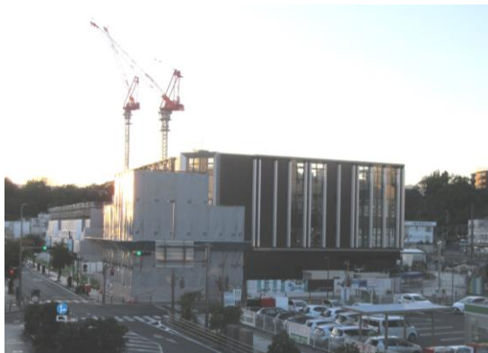
整備が進む並木通り (令和5(2023)年 10月 総合図書館撮影)

いわき駅西側の国道399号(通称並木通り)北側区域は「いわき駅並木通り地区第一種市街地再開発事業」として現在建設が進んでいます。新たに商業施設、マンション、オフィスが入るビルの整備等により、いわき駅前周辺はますます便利に賑わう街となっていく予定です。