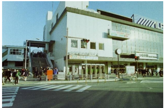
【平安橋】いわき駅前 (平成 11(1999)年 11 月 いわき市撮影)

平成 28(2016)年 3 月には駅北口交通広場も整備され、車や人の動線もスムーズになっていきました。