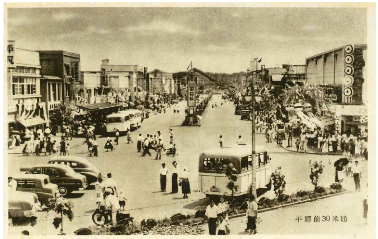
平駅前 30 米通 『平市絵葉書』絵はがき(平市役所 昭和 20 年代)

戦後復興が進み経済が活性化するなかで、日本国有鉄道（現・JR）は、老朽化していた駅舎を地元と共同で改築する計画を進めますが、改築に際しては、地元からの資金を得て、駅舎内に商業施設を設け、民衆駅スタイルを持ち込むことにしました。