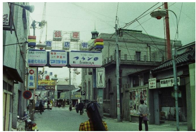
銀座通り沿いに本町通り方向を見る (昭和 49(1974)年 6 月 いわき市撮影)