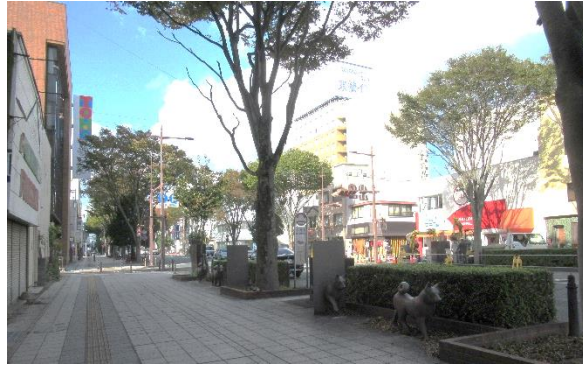
駅前通り 歩道 (令和 5(2023)年 10 月 総合図書館撮影)