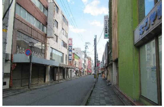
平和通り (令和 5(2023)年 10 月)