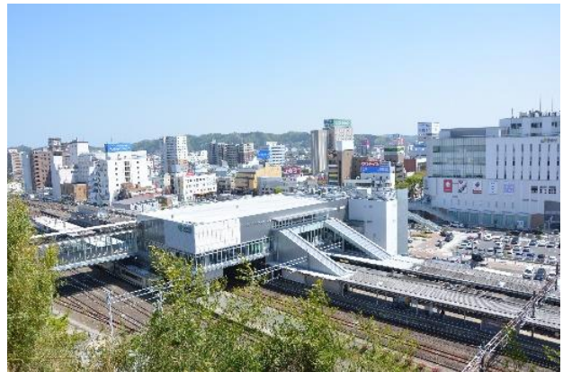
【平安橋】駅改修とともに利便性の高い南北自由通路へ (平成 27(2015)年 4 月 いわき市撮影)