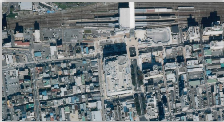
いわき駅周辺（平成23年10月26日）