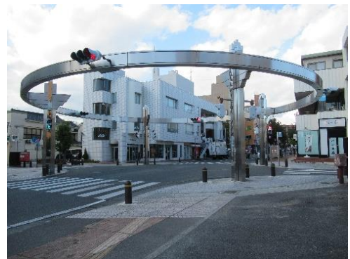
本町通り(令和5(2023)年10月 総合図書館撮影)

平字一町目に建てられたビルで、平の頭文字「T」と一町目の「一」をつなげ、T-1と付けられました。