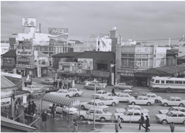
平(現・いわき)駅駅前広場と正面商店を駅舎 2 階から見る (昭和 47(1972)年 11 月頃 いわき市撮影)