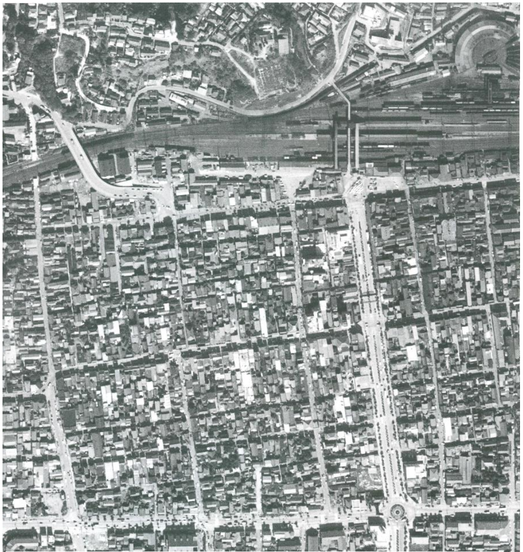
平駅周辺 (昭和 41(1966)年 10 月 20 日)