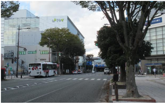
駅前大通り・左手にラブ、 中央奥にいわき駅 (令和 5(2023)年 10 月)