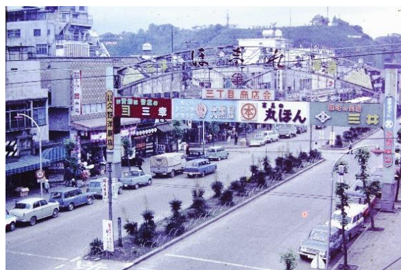
平(現・いわき)駅駅前通り・七十七銀行ビルから駅方面、西側市街を見る

一方、電化工事は平駅まで昭和 38(1963)年に完成し、無煙化、つまり蒸気機関車から電気機関車への移行が進んでいきました。この過程で、最大 27 両を格納できる扇形の平機関庫は、昭和 45(1970)年に廃止されました。