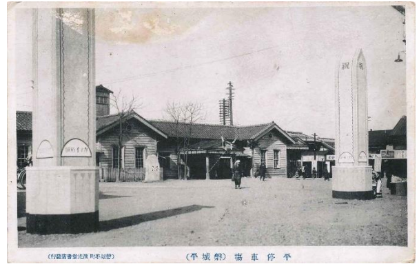
平駅および駅前 国産奨励勸業博覧会の歓迎塔が建つ

一町目～五町目の本町通りには、相次いで銀行が進出し、平駅に近い二町目～四町目を中心に、商業や娯楽などが賑わっていきました。都会になった街は人々のあこがれの存在となり、本町通り、特に二町目・三町目の絵はがきが何種類も発行されました。