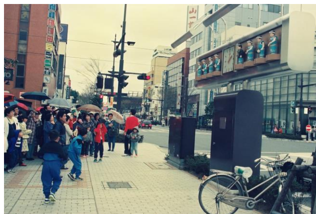
平(現・いわき)駅駅前通り ・じゃんがら念仏踊りからくり時計お披露目 (平成 4(1992)年 4 月)