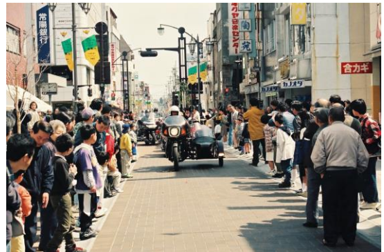
本町通りの字二町目、同字三町目を西側から見る・ショッピングモール開通式(平成7(1995)年4月)

その後、紆余曲折を経て、平成14(2002)年4月、一町目に再開発ビル「いわきT-1ビル(イワキティーワンビル)」が完成しました。17階建てで、飲食・商業店舗、ワシントンホテル、マンションなどが入り、このうち公共施設としては市生涯学習プラザ(4・5階)、市消費生活センター(4階)が開設されました。いわきT-1ビルは本町通りと掻槌小路交差点の近くにあり、平市街地の回遊性を促す一つの核となることを目指しました。